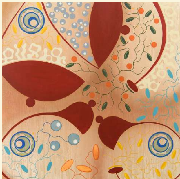
Inès-Noor Chaqroun, TÊTES-LA-VIE, 2023, Huile et spray acrylique sur toile 150 x 150 cm © Fouad Maazouz