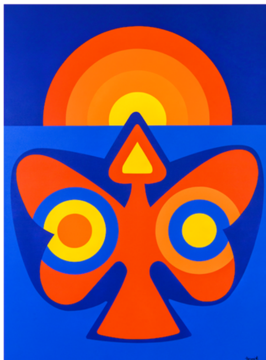
Mohamed Hamidi, Sans titre , 2021, Cellulose Paint on canvas, 200 x 150 cm

Elle célèbre l'homme et le peintre, celui qui, en cherchant « une synthèse de l'art arabo-musulman ouverte aux autres formes esthétiques », a donné à la peinture marocaine son élan universel.