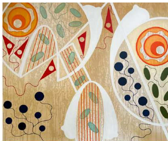
CAP, ON CAPTIVE ?