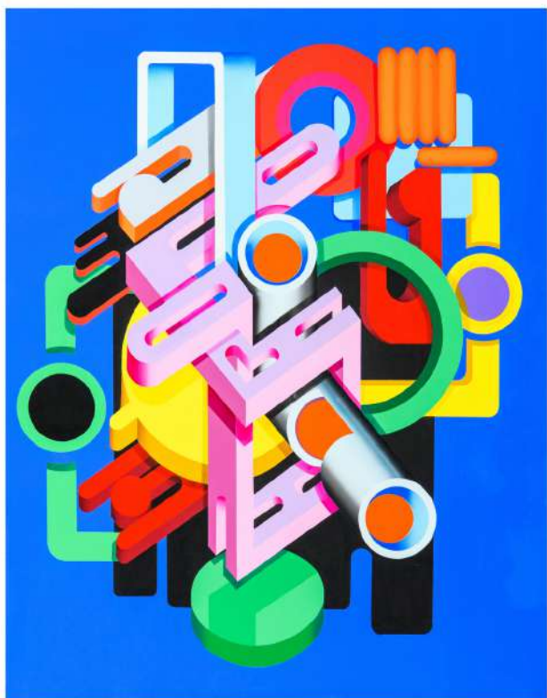
Meriam Benkirane, Chemin insulaire , 2021, Acrylique sur toile, 140x110 cm

Le progrès tend-il nécessairement vers un but idéal commun ? Les transformations qu'il engendre sont-elles intrinsèquement synonymes d'évolutions ? La quête du perfectionnement est-elle illimitée ? Autant de questionnements que peuvent susciter les oeuvres de l'artiste Meriam Benkirane qui seront à découvrir à La Galerie 38 à l'occasion de son exposition "Reflect" du 3 juin au 3 juillet 2022. Le monde d'aujourd'hui, les hommes et les femmes qui l'habitent, est celui auquel Meriam Benkirane s'intéresse. Elle en propose une représentation symbolique.