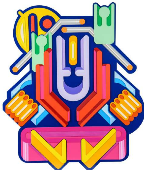
Meriam Benkirane, Victorious , 2022, Peinture cellulosique sur bois, 148x176 cm

L'artiste multi-facettes offre au spectateur l'occasion de réfléchir, de se questionner sur la multitude de paradoxes que la société renferme. Une société obsédée par l'idée d'avancées techniques, technologiques et où l'humanité est parfois oubliée. Par son art, de la composition fait de formes imbriquées, architecturées, vives, d'une modernité implacable, l'artiste casablancaise tend un miroir au spectateur. Elle offre ainsi un véritable reflet de la vie urbaine contemporaine. Sous la forme de mécanismes puissamment colorés, ce sont les rouages du vivre-ensemble que l'on peut voir se dessiner. Meriam Benkirane apporte son éclairage avec subtilité et intensité sur un environnement citadin, le sien, le vôtre, le nôtre.