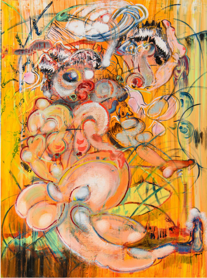
Fathiya Tahiri, Histoire, 2021, Huile sur toile, 200 x 150 cm

L'exposition captivante "Le songe d'une nuit d'hiver" de Fathiya Tahiri nous plonge dans l'univers riche et singulier d'une artiste marocaine éminente. Fathiya Tahiri se distingue par sa générosité artistique, sa polyvalence et sa sincérité émouvante. Refusant de se confiner à un seul médium, elle explore inlassablement de nouveaux horizons, repoussant constamment les limites de son expression.