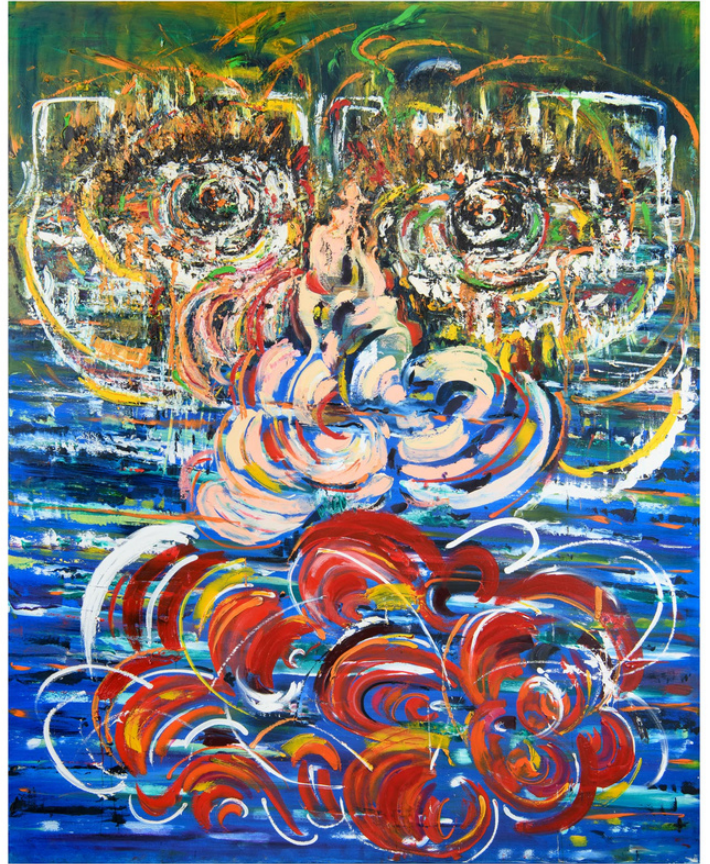
Fathiya Tahiri, Regard 5, 2021, Huile sur toile, 115 x 80 cm

Vernissage de l'exposition le jeudi 15 février à partir de 19h30.