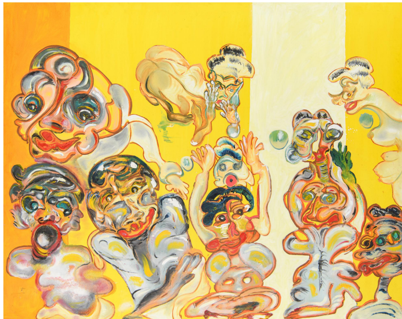
Fathiya Tahiri, Inspiration, 2023, Huile sur toile, 200 x 250 cm