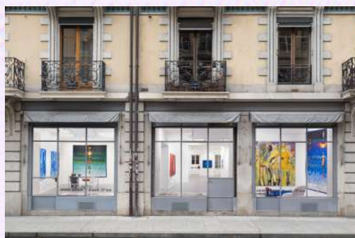
La Galerie 38 Casablanca, Marrakech et Genève