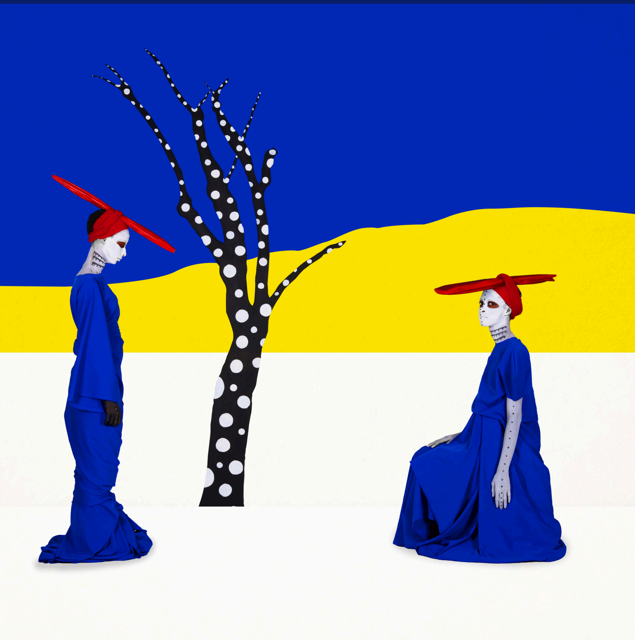
In Which We Remain The Road of Glory Series, 2020 Archival digital photograph 80 × 80 cm Edition 4/7 Commissioned by the Nobel Peace Center

Born in Addis Ababa in 1974, Aida Muluneh graduated from Howard University in Washington, D.C., with a degree in Communications, majoring in Film. Her photography has been widely published and is included in the permanent collections of prestigious institutions such as the Museum of Modern Art (MoMA), the Smithsonian's National Museum of African Art, the Hood Museum, the RISD Museum of Art, and the Museum of Biblical Art in the United States. Muluneh received the European Union Prize at the Rencontres Africaines de la Photographie in Bamako, Mali, in 2007, the CRAF International Award of Photography in Spilimbergo, Italy, in 2010, and was a CatchLight Fellow in San Francisco, USA, in 2018. In 2020, she was honored with the Royal Photographic Society Award in Curatorship.