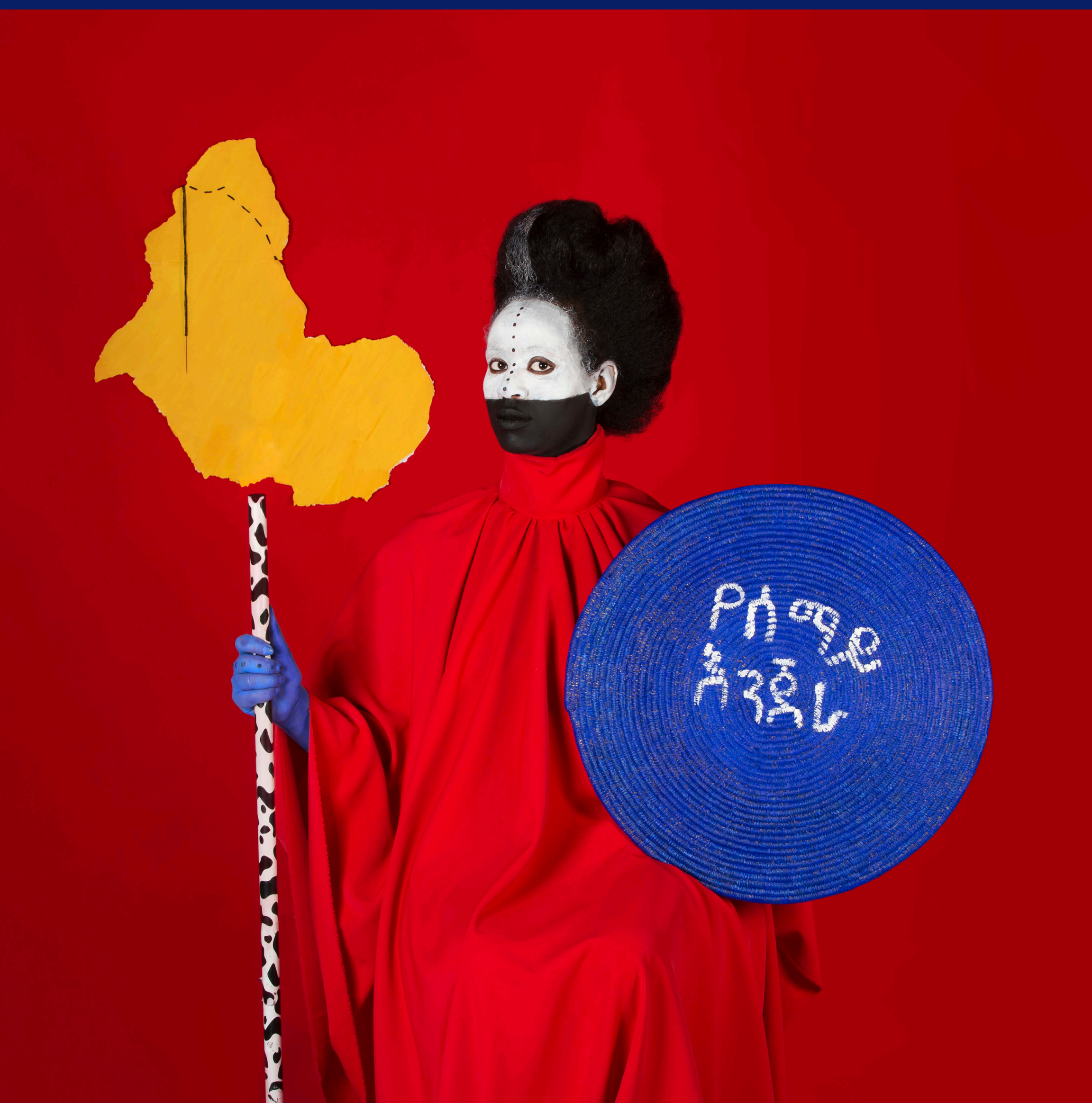
Red Hour Memories in Development Series, 2017 Archival digital photograph 80 × 80 cm Edition 5/7

La Galerie 38 is pleased to announce A Real Fiction , an exhibition by artist Aida Muluneh, opening on Thursday, May 21 in Casablanca.