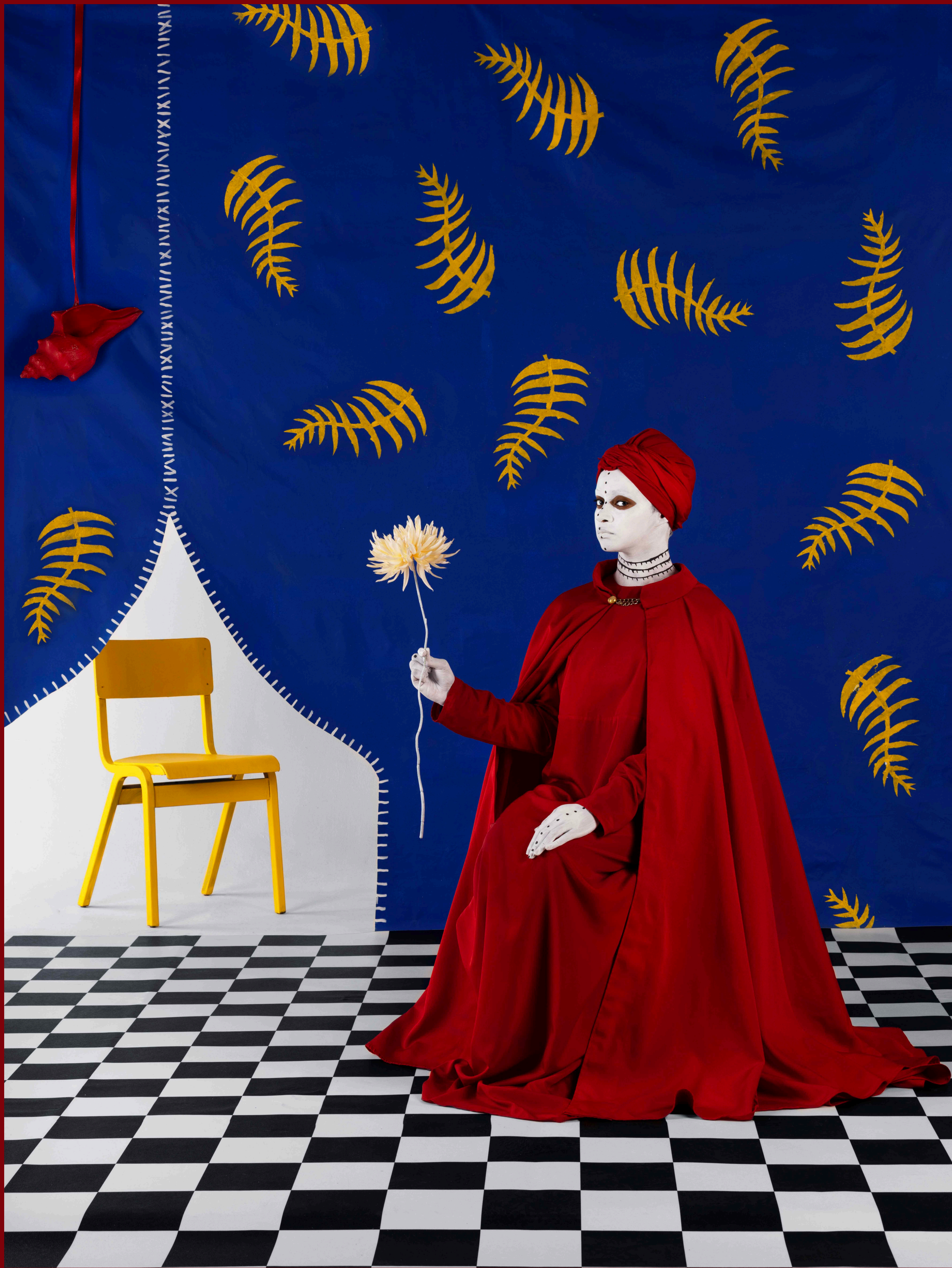
The Dew at Dawn, The Necessity of Seeing Series, 2024, Archival digital photograph, 90 x 67.5 cm, Commissioned by Bradford 2025, UK City of Culture